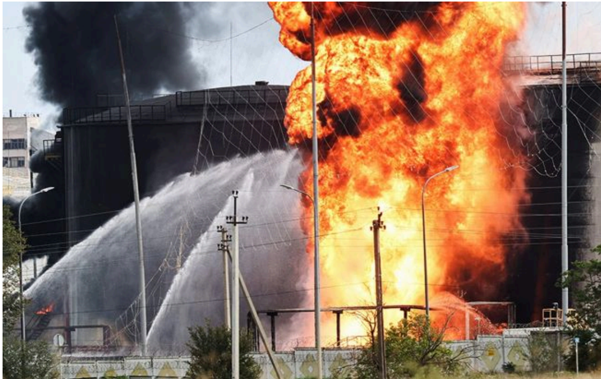
Фото: Сили оборони уразили нафтобази у Криму (росЗМ)