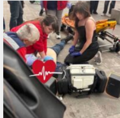
«А МИ ТУТ ПРИ ЧОМУ?». Смертельна відмова за п'ять хвилин від порятунку та ціна байдужості кївської підземки