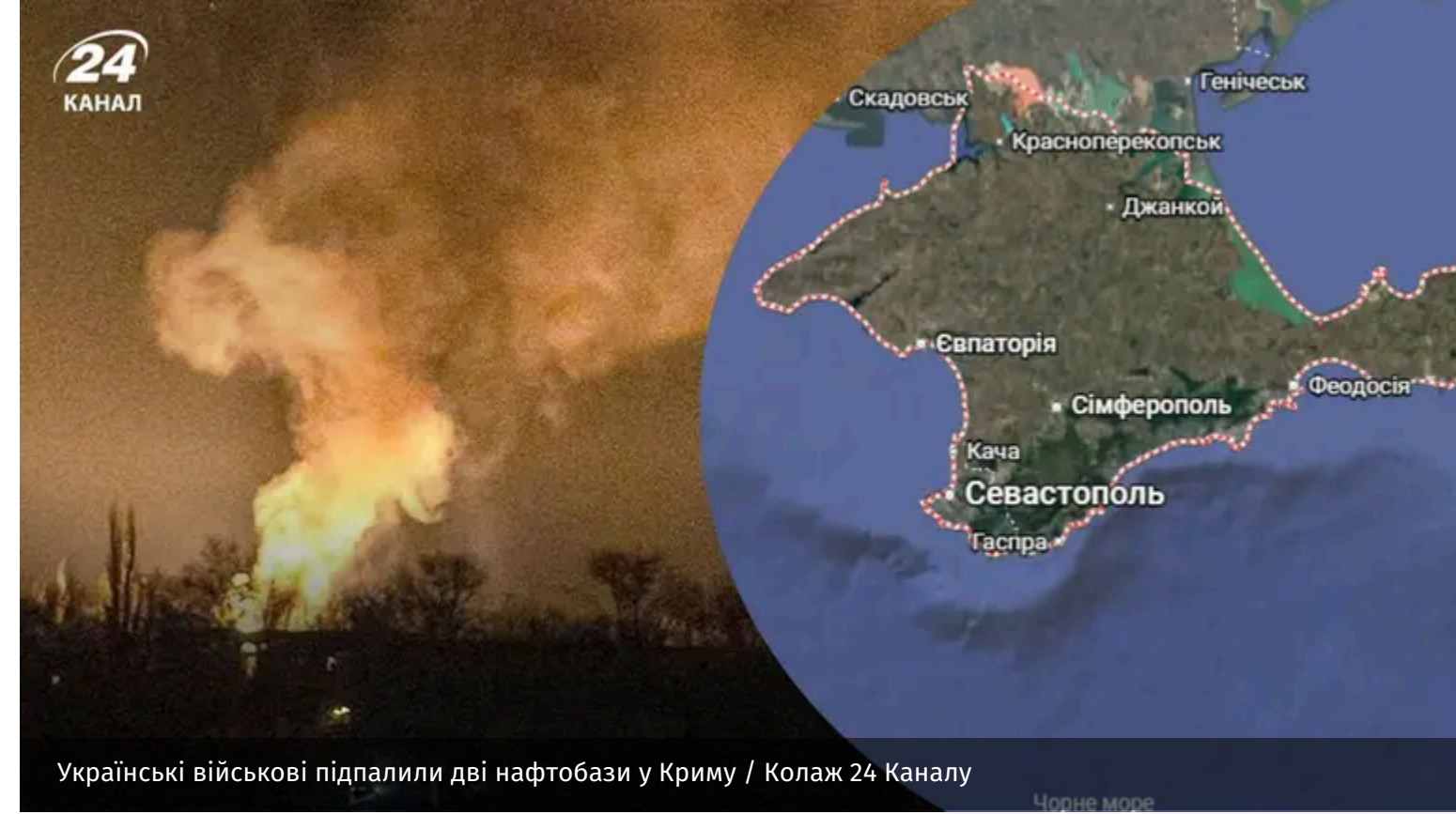
Українські військові підпалили дві нафтобази у Криму

Уночі 7 червня Сили оборони вдарили по кількох важливих для окупантів об'єктах. Аж дві нафтобази були уражені в Криму.