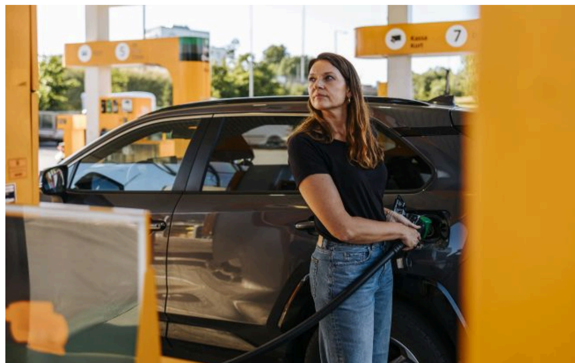
Фото: Бензин, дизель та газ різко подешевшали