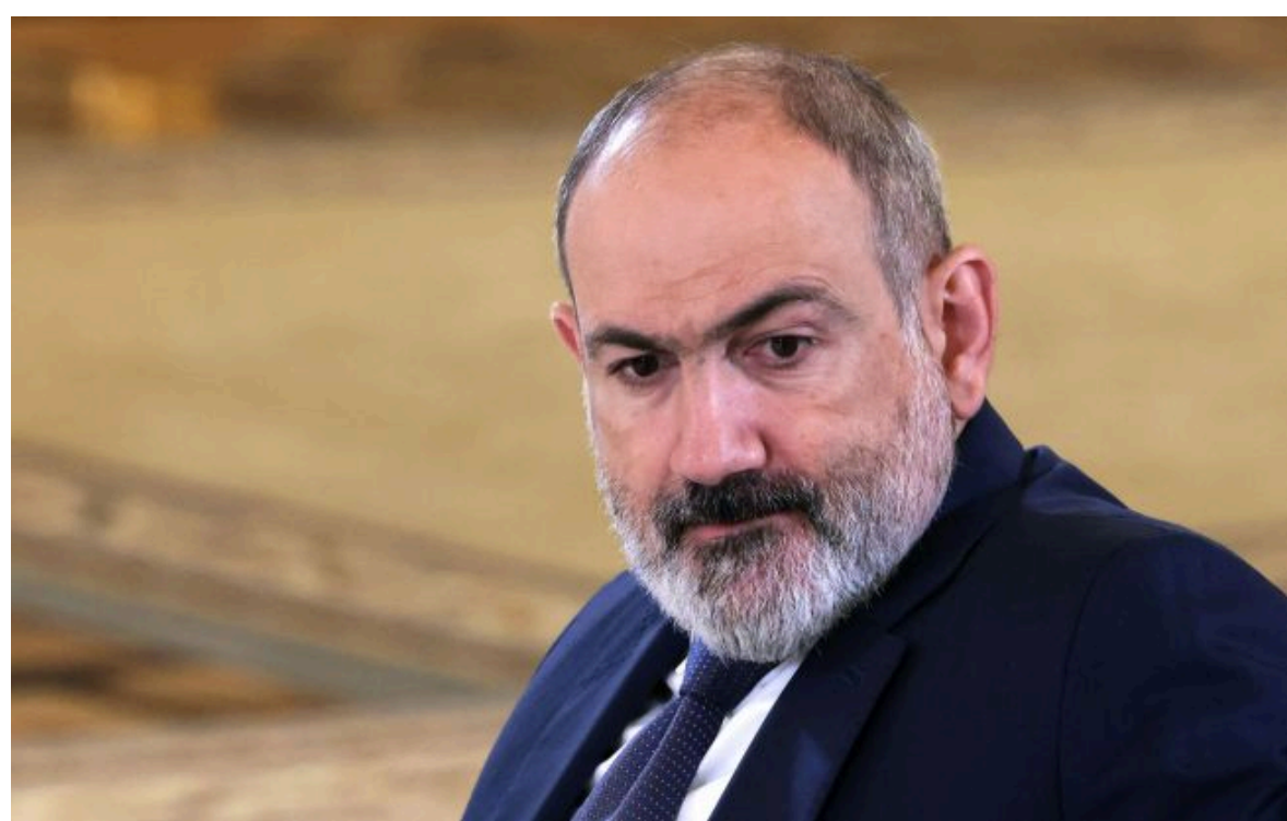
Фото: прем'єр-міністр Вірменії Нікол Пашинян