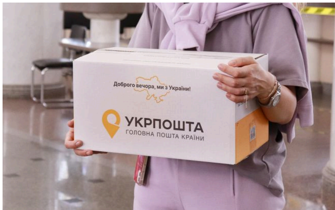
Фото: що відомо про руйнування на Укрпошті в Харкові