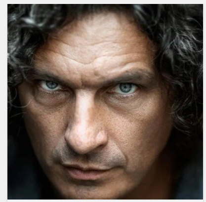
Водій смітєвоза, стоматолог, лейтенант: цікаві факти із ..