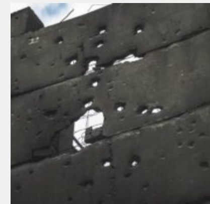
Як виглядає українська ТЕЦ, що пережила не одну ракетну атаку російських загрозливіків