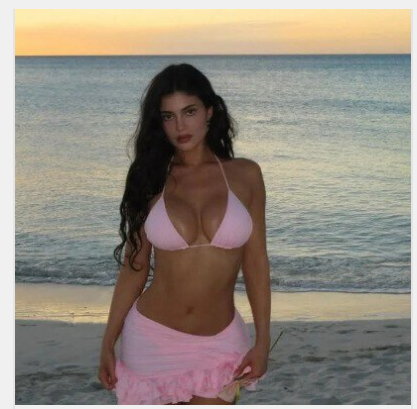
Корпоратив на мільйон: Кайлі Дженнер у бікіні засвітила ..