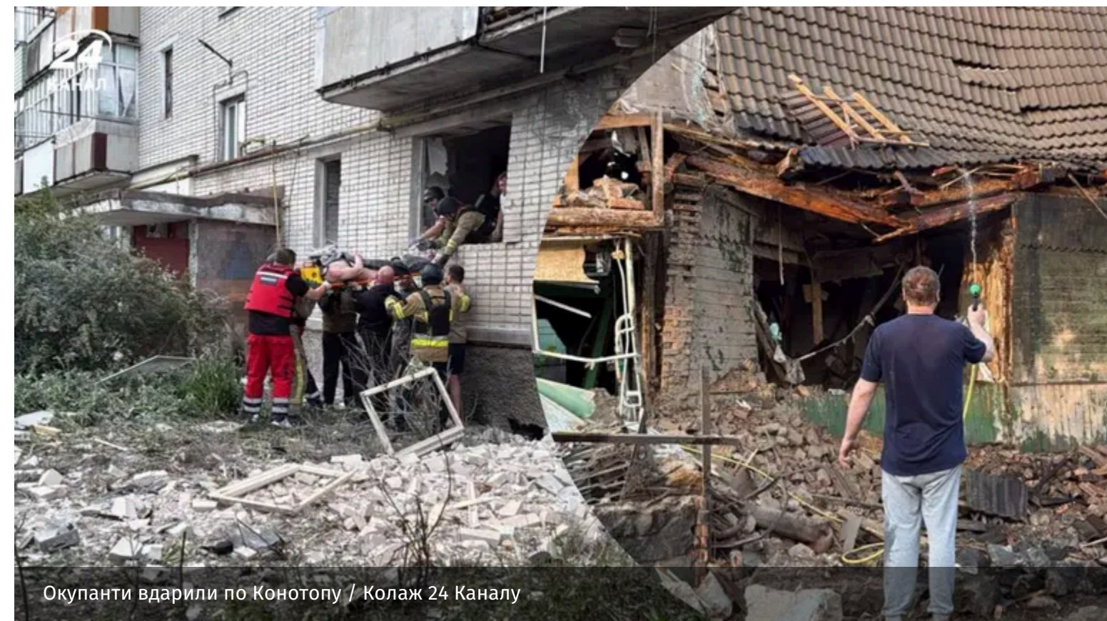
Окупанти вдарили по Конотопу

Вранці росіяни атакували Конотоп кількома дронами. Під ударом опинився житловий сектор.