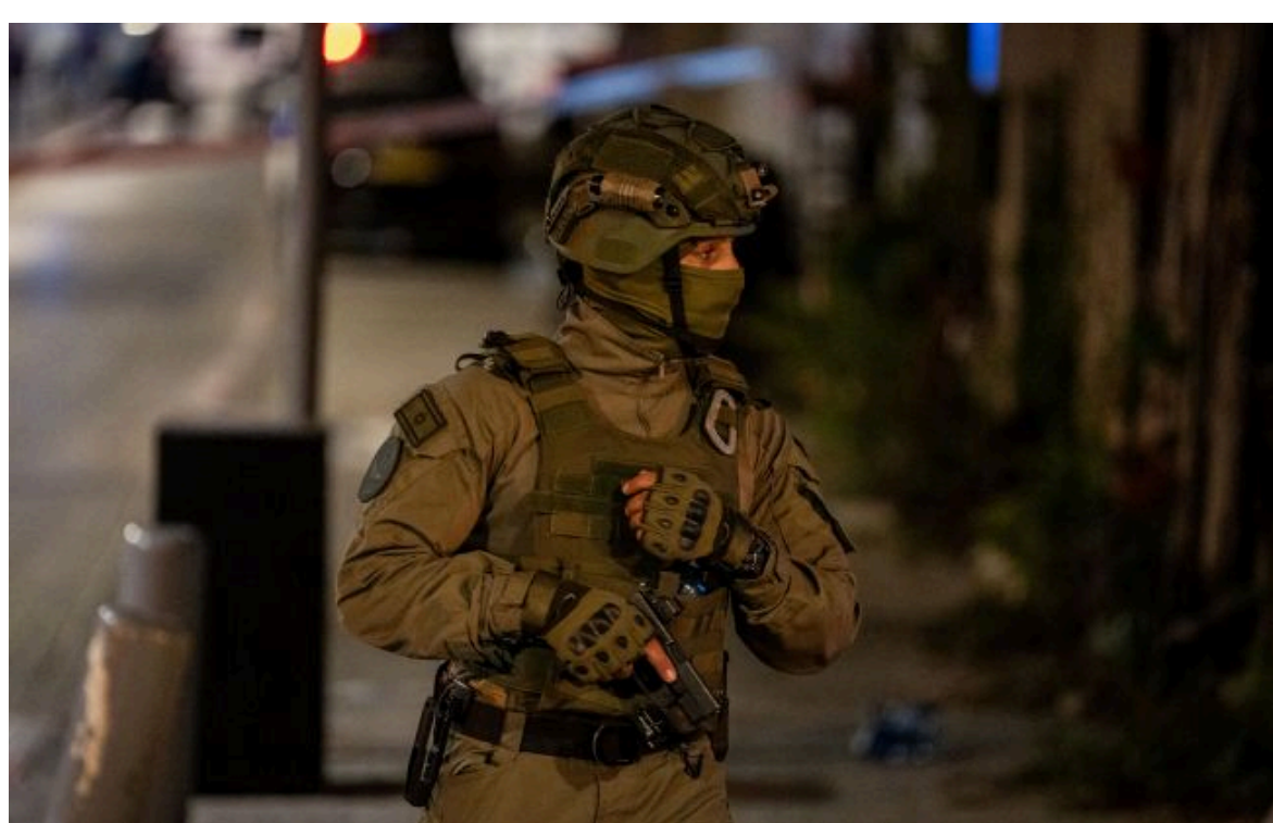
Фото: перемир'я на Близькому Сході закінчилося обміном ударами між Ізраїлем та Іраном

Вимкни хаос міжнародних новин! Отримуй тільки важливе з РБК-Україна у Google