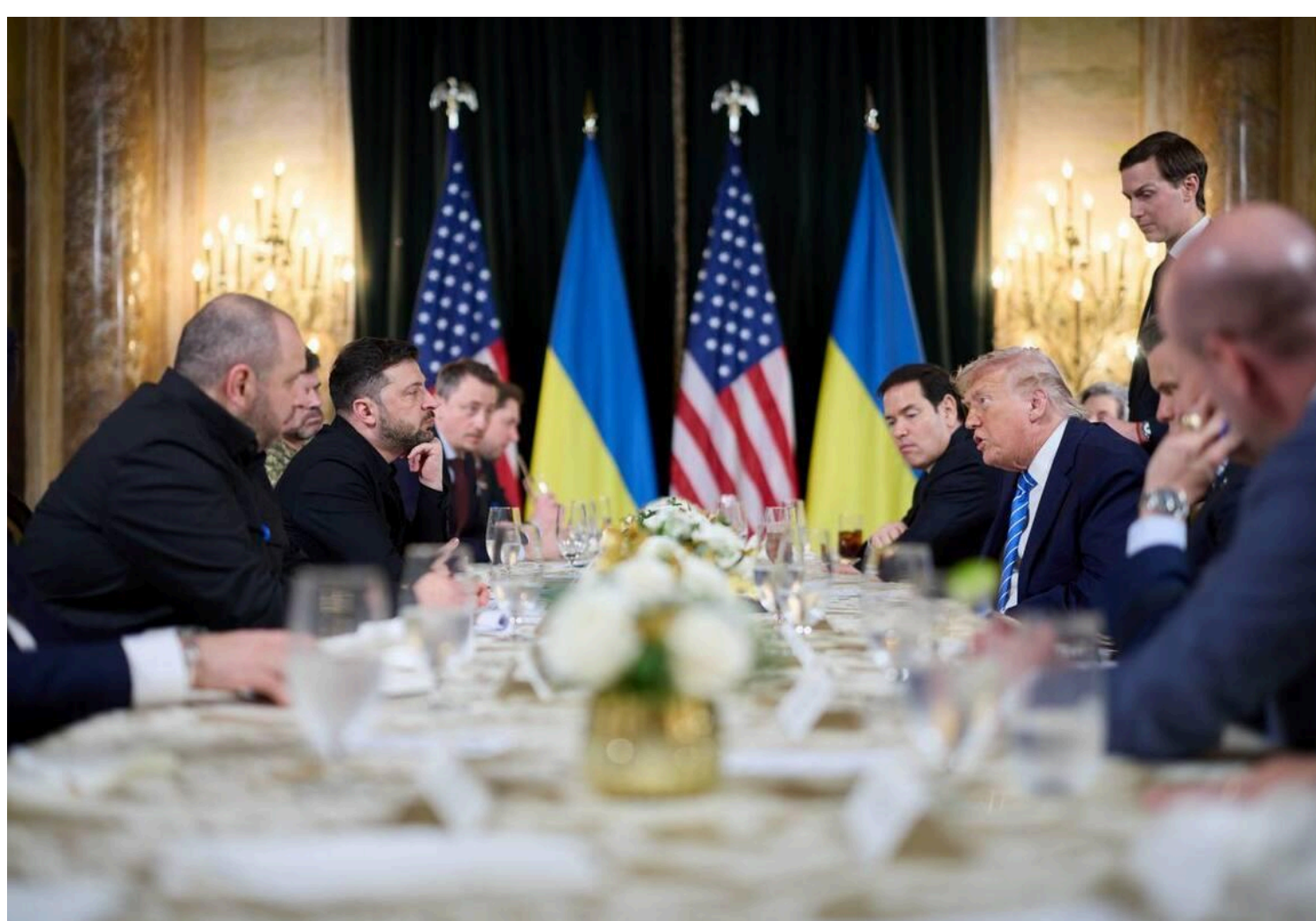
Однак Трамп досі не може перейти на правильну сторону та критикує Україну

За словами політика, Америка повинна беззастережно підтримувати правильну сторону у війні між РФ та Україною.