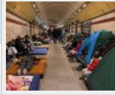
«Пішло все в сраку, йдемо в укриття». Проблему з укриттями в столиці так і не вирішили