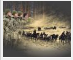
Війна і мобілізація