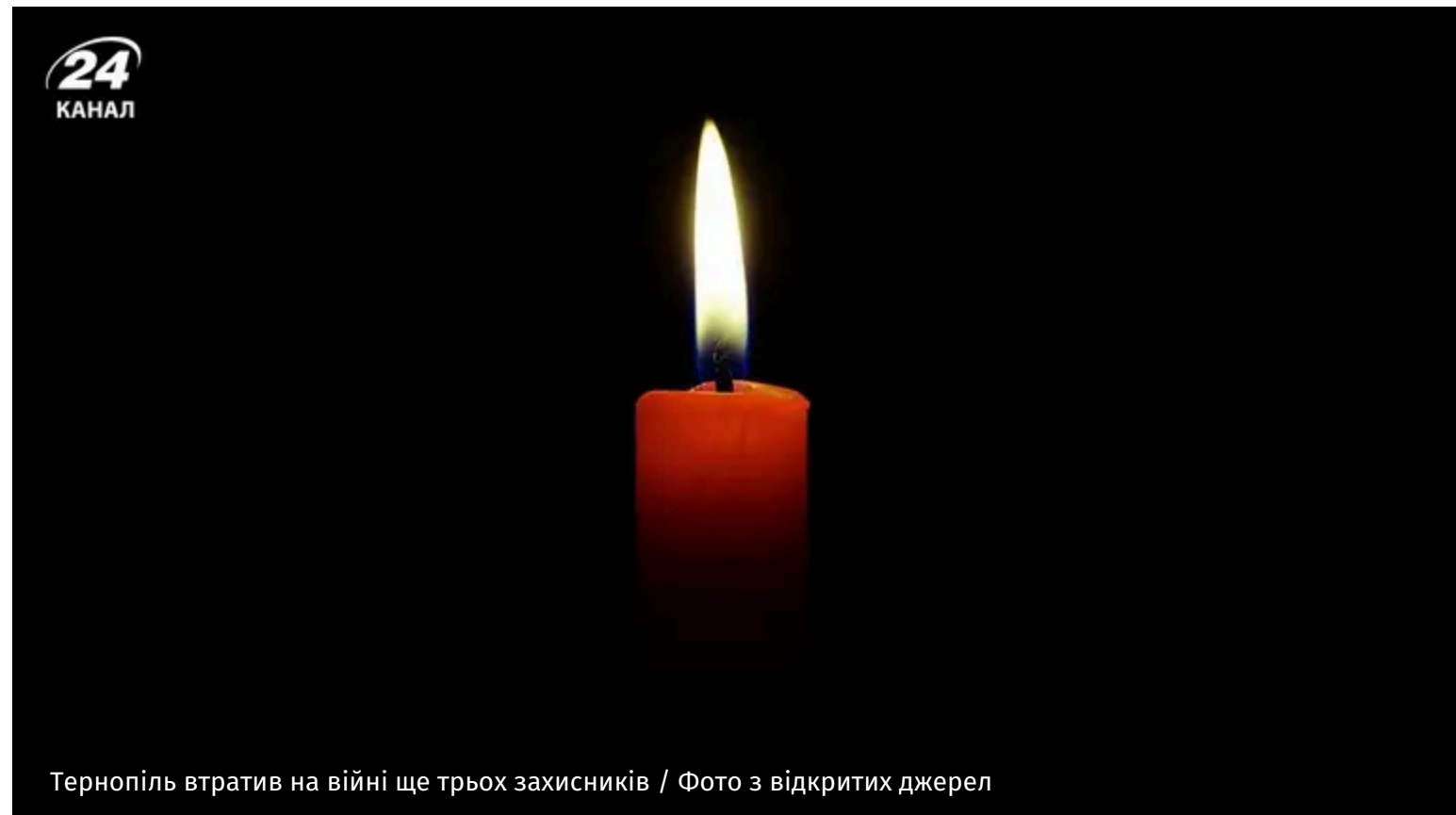
Тернопіль втратив на війні ще трьох захисників

Україна продовжує втрачати найкращих синів і дочок, які стали на захист її свободи. Серед них – троє уродженців Тернополя.