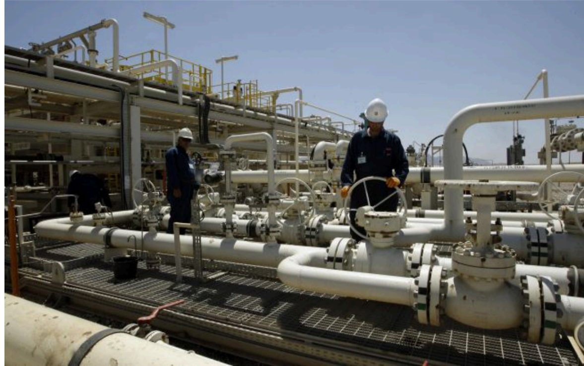
Фото: ринок нафти реагує на ескалацію на Близькому Сході □□□□□□