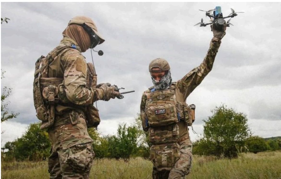
Фото: бійці ЗСУ запускають дрон (Генштаб ЗСУ)