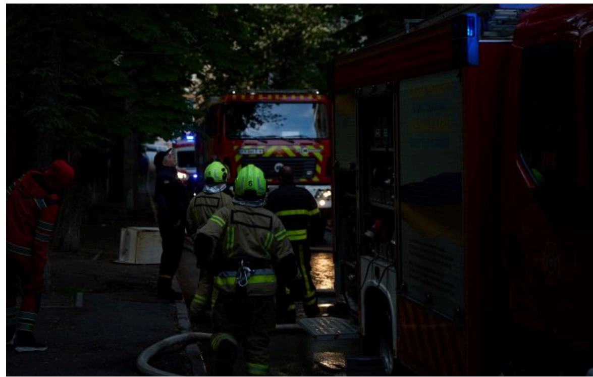
Фото: на місці працює спеціальна техніка (facebook.com/DSNSKyiv)