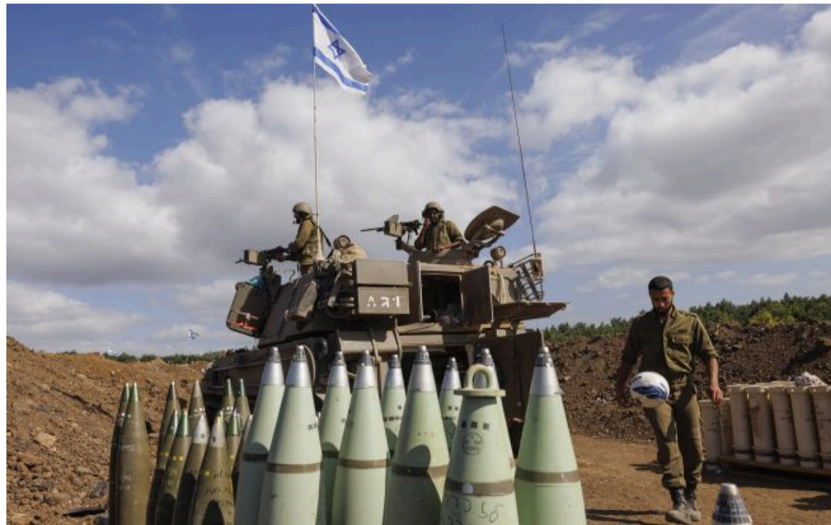
Фото: військові армії Ізраїлю (Getty Images)