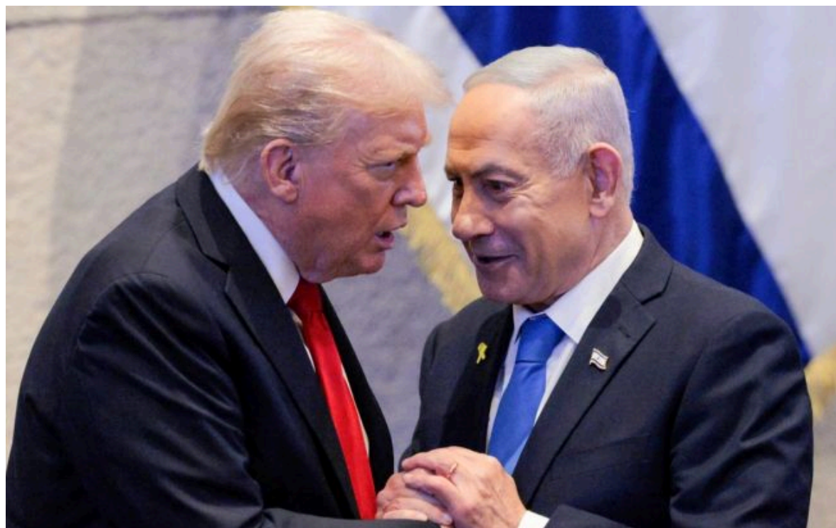
Фото: президент США Трамп та прем'єр Ізраїлю Нетаньягу

Вимкни хаос міжнародних новин! Отримуй тільки важливе з РБК-Україна у Google