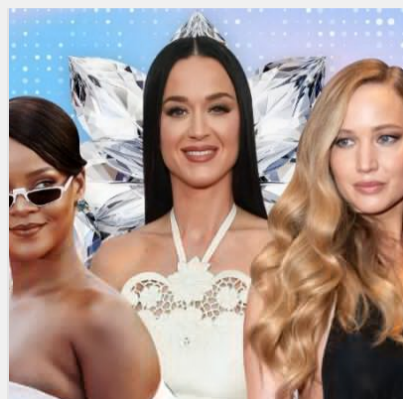
10 зірок без освіти: хто зі знаменитостей так і не закінчив ..