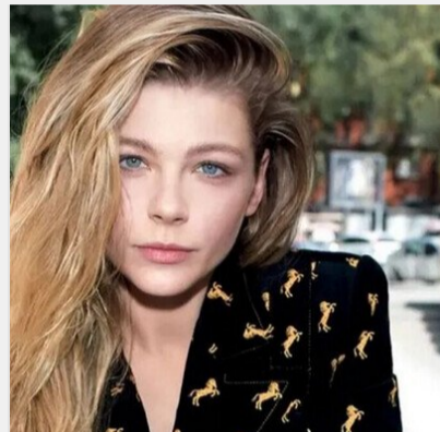
Або самогубство, або лікування: акторка Анастасія Пустовіт ..