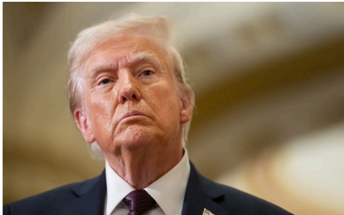
Фото: президент США Дональд Трамп (Getty Images)

Вимкни хаос міжнародних новин! Отримуй тільки важливе з РБК-Україна у Google