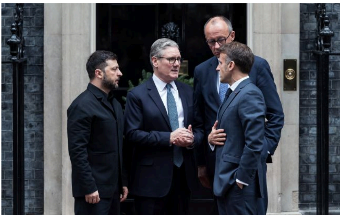
Фото: президент України Володимир Зеленський, прем'єр-міністр Великої Британії Кір Стармер, канцлер Німеччини Фрідріх Мерц та президент Франції Еммануель Макрон

Не витрачай час на шум! Читай тільки суть з РБК-Україна у Google