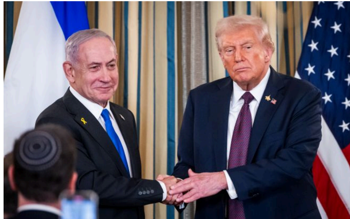
Фото: президент США Трамп та прем'єр Ізраїля Нетаньягу (Getty Images)

Вимкни хаос міжнародних новин! Отримуй тільки важливе з РБК-Україна у Google