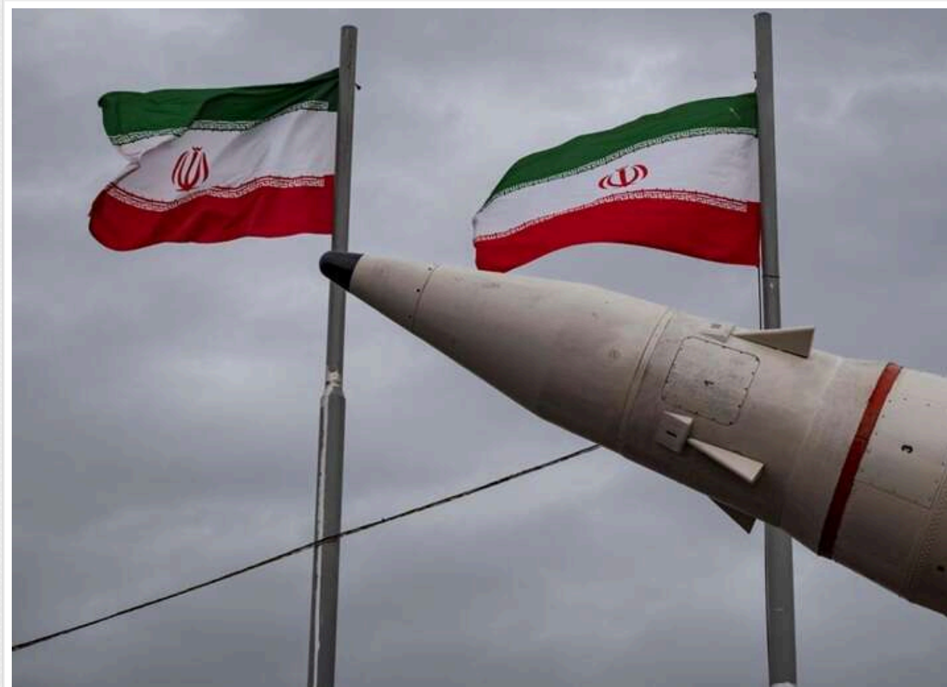
ЦАХАЛ перехопив усі іранські ракети, а влада Ізраїлю офіційно анонсувала відповідь на обстріл

Ізраїльська влада заявила про майбутню відповідь на ракетний обстріл з боку Ірану, повідомила державна телерадіокомпанія Кап з посиланням на ізраїльських чиновників.