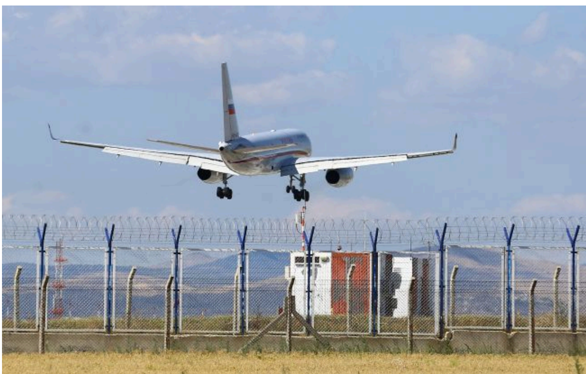
Фото: аеропорт Сочі скасував рейси через атаки дронів

Вимкни хаос міжнародних новин! Отримуй тільки важливе з РБК-Україна у Google