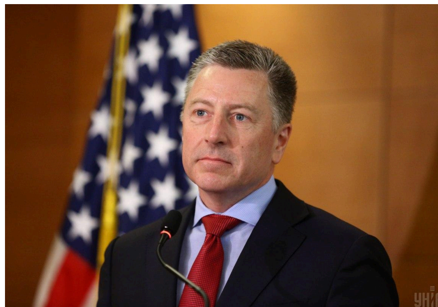
Окремою проблемою для Кремля, за словами Волкера, стане і саме завершення війни | УНІАН

Колишній спецпредставник США пояснив, чому Кремль може сам себе знищити.