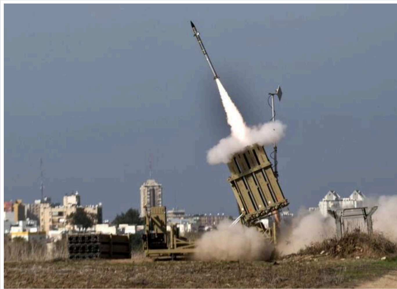
Іран атакував Ізраїль ракетами: ЦАХАЛ підтвердив удари, а Тель-Авів готує відповідь

Армія Ізраїлю підтвердила запуск іранських ракет по ізраїльській території.