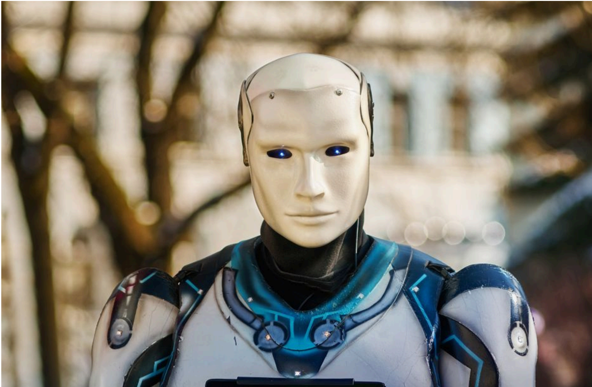
Штучний інтелект

ДМИТРУК АНДРІЙ — 07 Червня 2026, 21:44 2 Mins Read — ТЕХНОЛОГІЇ