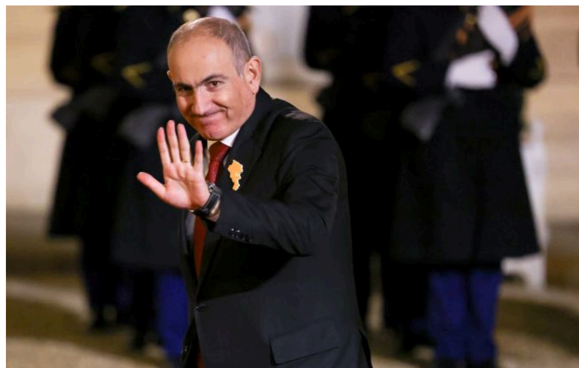
Фото: прем'єр-міністр Вірменії Нікол Пашинян (Getty Images)