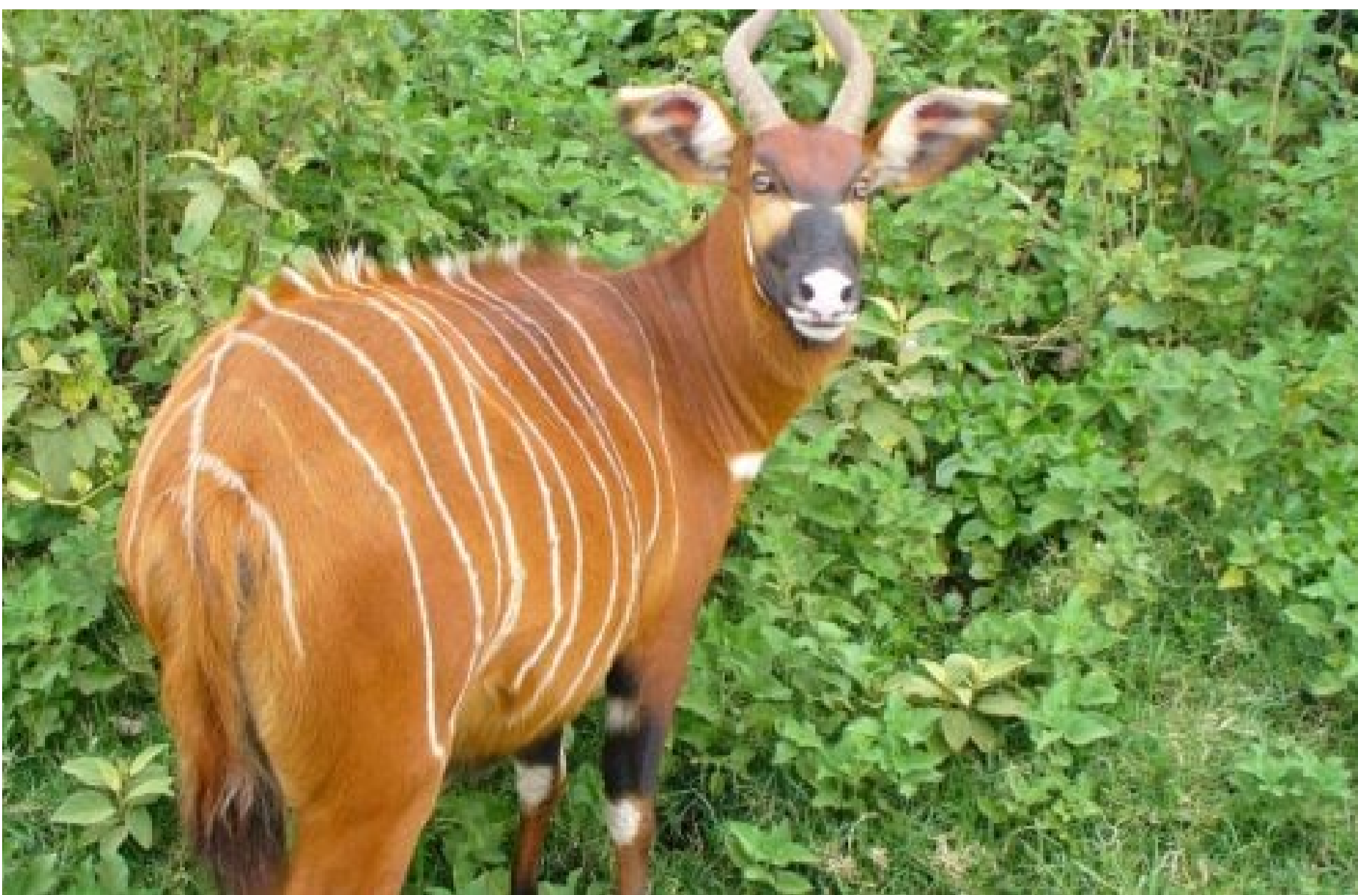
Антилопа бонго

КОВАЛЬЧУК СВІТЛАНА — 07 Червня 2026, 21:13 2 Mins Read — ТВАРИНИ