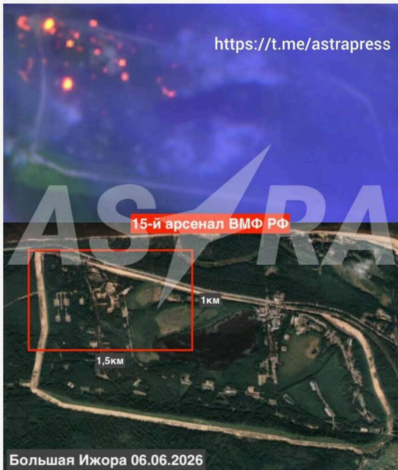
У Ленінградській області РФ горить арсенал ВМФ після атаки дронів: пожежу видно з космосу