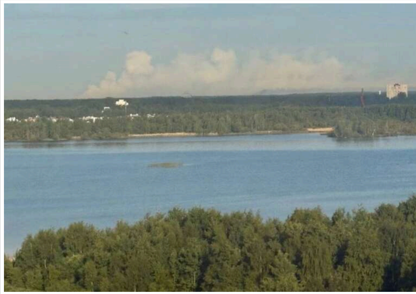
У Ленінградській області РФ горить арсенал ВМФ після атаки дронів: пожежу видно з космосу

Після атаки дронів на Санкт-Петербурзі і Ленінградську область РФ 6 червня на території арсеналу ВМФ Росії в Ломоносовському районі спалахнули пожежі, які видно навіть із космосу.