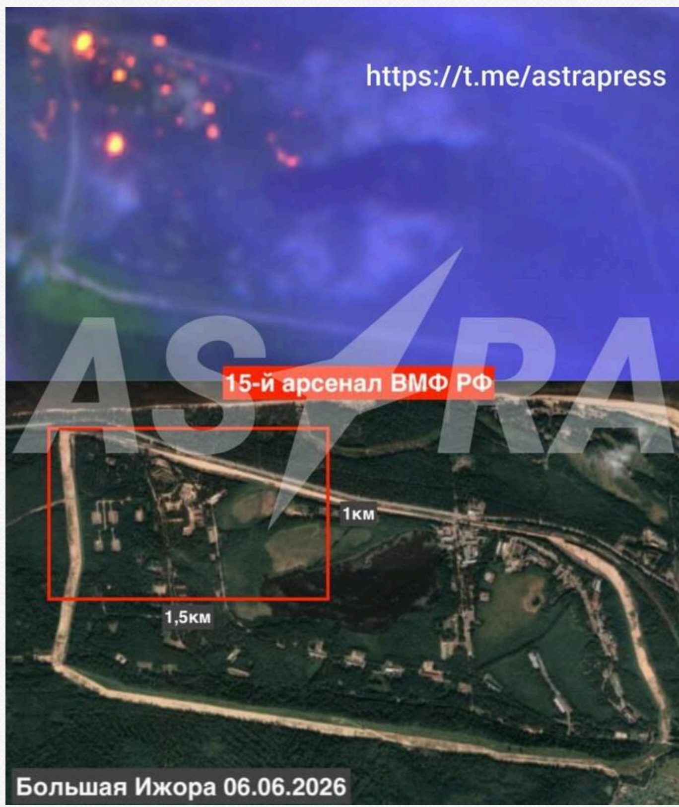
У Ленінградській області РФ горить арсенал ВМФ після атаки дронів: пожежу видно з космосу

6 червня очевидці бачили стовпи диму над арсеналом. Місцева влада оголосила евакуацію жителів сусідніх населених пунктів – усього близько 600 осіб. Губернатор Ленінградської області Олександр Дрозденко заявив, що четверо людей дістали поранення.