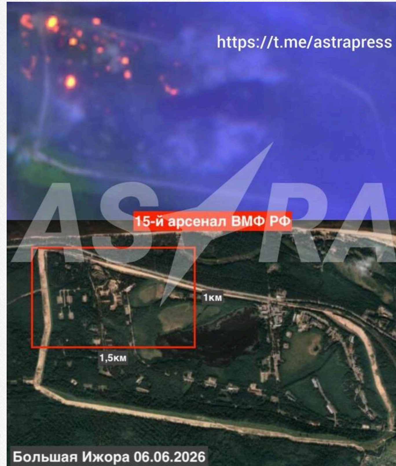
У Ленінградській області РФ горить арсенал ВМФ після атаки дронів: пожежу видно з космосу

6 червня очевидці бачили стовпи диму над арсеналом. Місцева влада оголосила евакуацію жителів сусідніх населених пунктів – усього близько 600 осіб. Губернатор Ленінградської області Олександр Дрозденко заявив, що четверо людей дістали поранення.