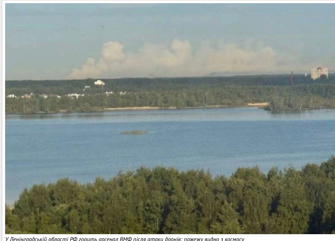
У Ленінградській області РФ горить арсенал ВМФ після атаки дронів: пожежу видно з космосу

Після атаки дронів на Санкт-Петербург і Ленінградську область РФ 6 червня на території арсеналу ВМФ Росії в Ломоносовському районі спалахнули пожежі, які видно навіть із космосу.