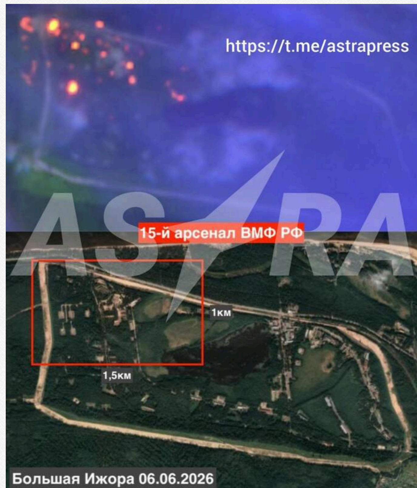
У Ленінградській області РФ горить арсенал ВМФ після атаки дронів: пожежу видно з космосу

6 червня очевидці бачили стовпи диму над арсеналом. Місцева влада оголосила евакуацію жителів сусідніх населених пунктів — усього близько 600 осіб. Губернатор Ленінградської області Олександр Дрозденко заявив, що четверо людей дістали поранення.