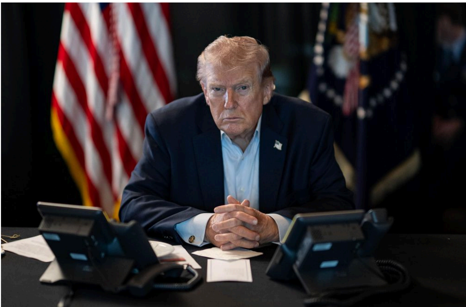
Дональд Трамп