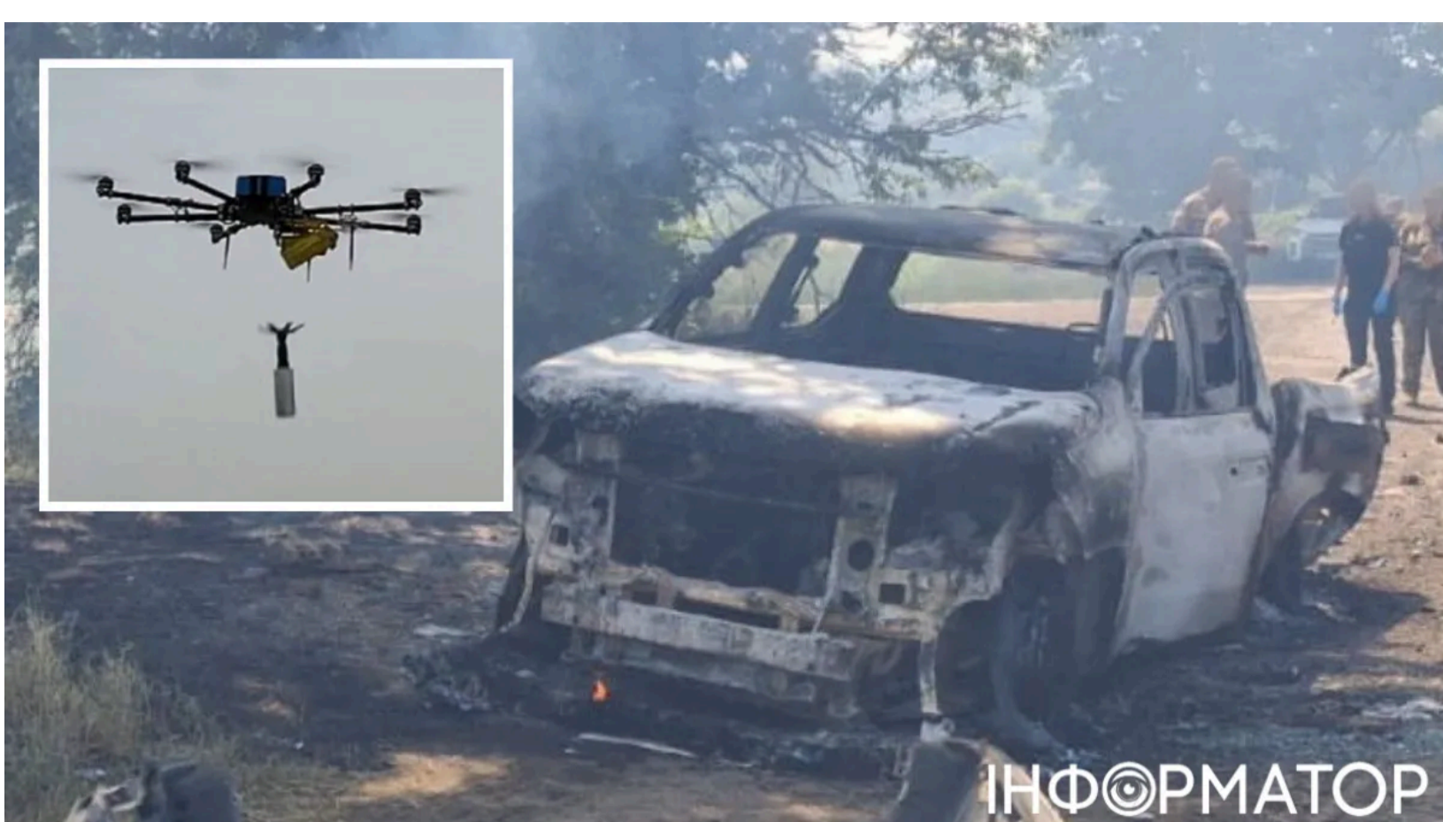
Загинув вибухотехнік поліції на Харківщині

На Харківщині під час роботи поліцейських вибухотехніків ворожий безпілотник вдарив по їхньому службовому автомобілю. Подібна трагедія вже відбувалася на Харківщині - рік тому дрон вдарив по машині саперів під час розмінування. Від удару на місці загинув один поліцейський, ще троє співробітників та цивільна людина отримали поранення. Усі постраждалі отримують медичну допомогу.