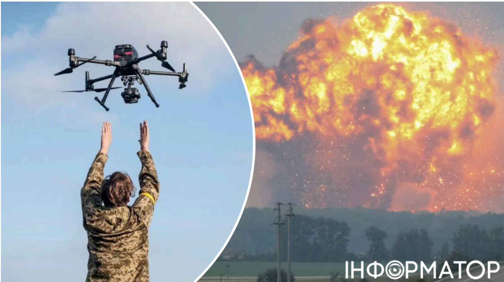
Дрони ЗСУ палять склади ворога в Бахмуті

Українські пілоти БПЛА методично знищують техніку, склади та позиції окупантів у тимчасово захопленому Бахмуті - місті, яке росіяни досі вважали надійним тилом. Подібна тактика ударів по ворожій логістиці на Донеччині стала системною для Сил оборони України . Розвідка фіксує: окупанти все частіше скаржаться на брак боєприпасів - і це результат роботи українських дронів.