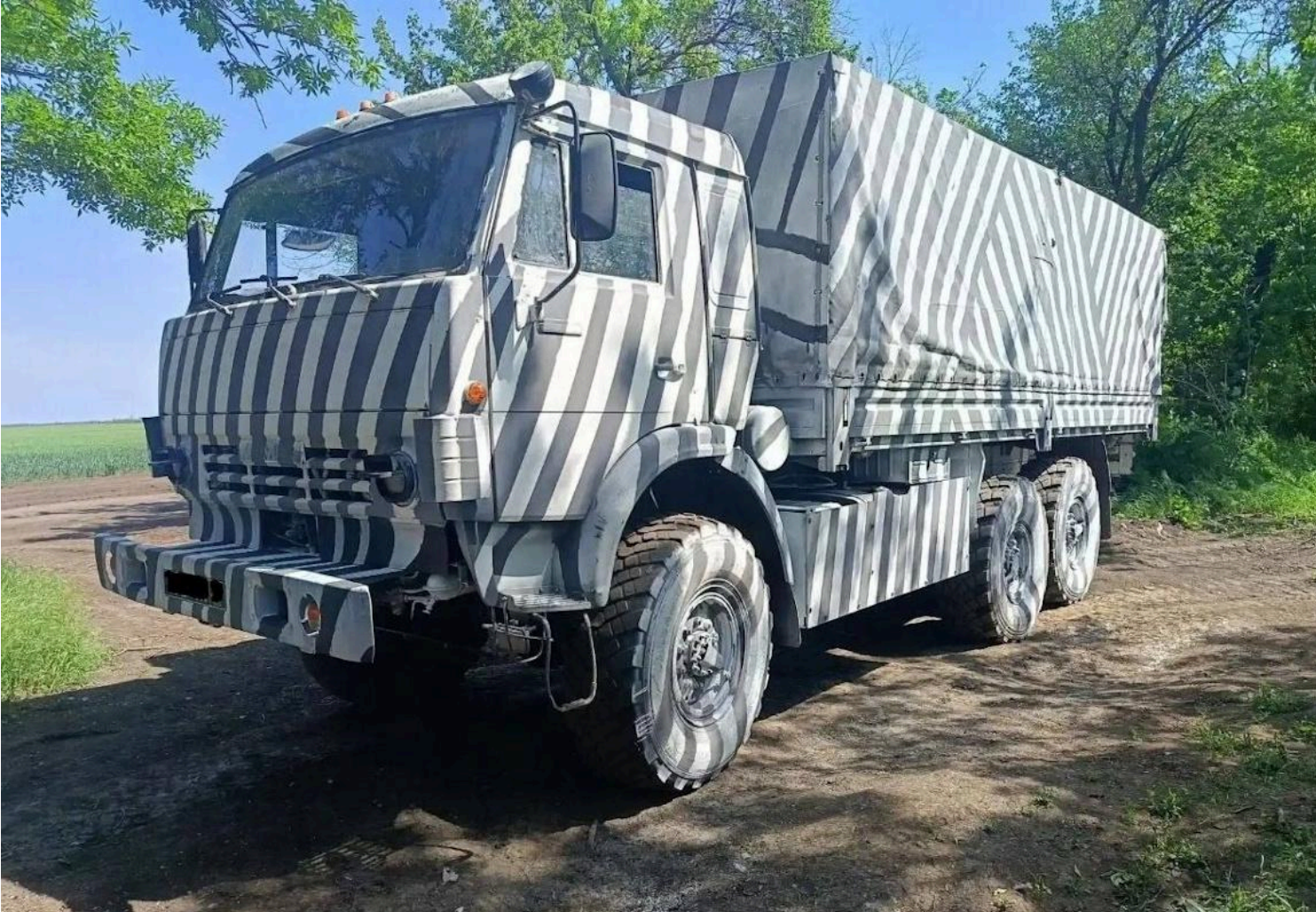
Російський військовий Камаз із новим камуфляжем

Західні експерти вважають, що ідея росіян розфарбувати військову техніку "під зебру", щоб надурити українські дрони, може спрацювати.