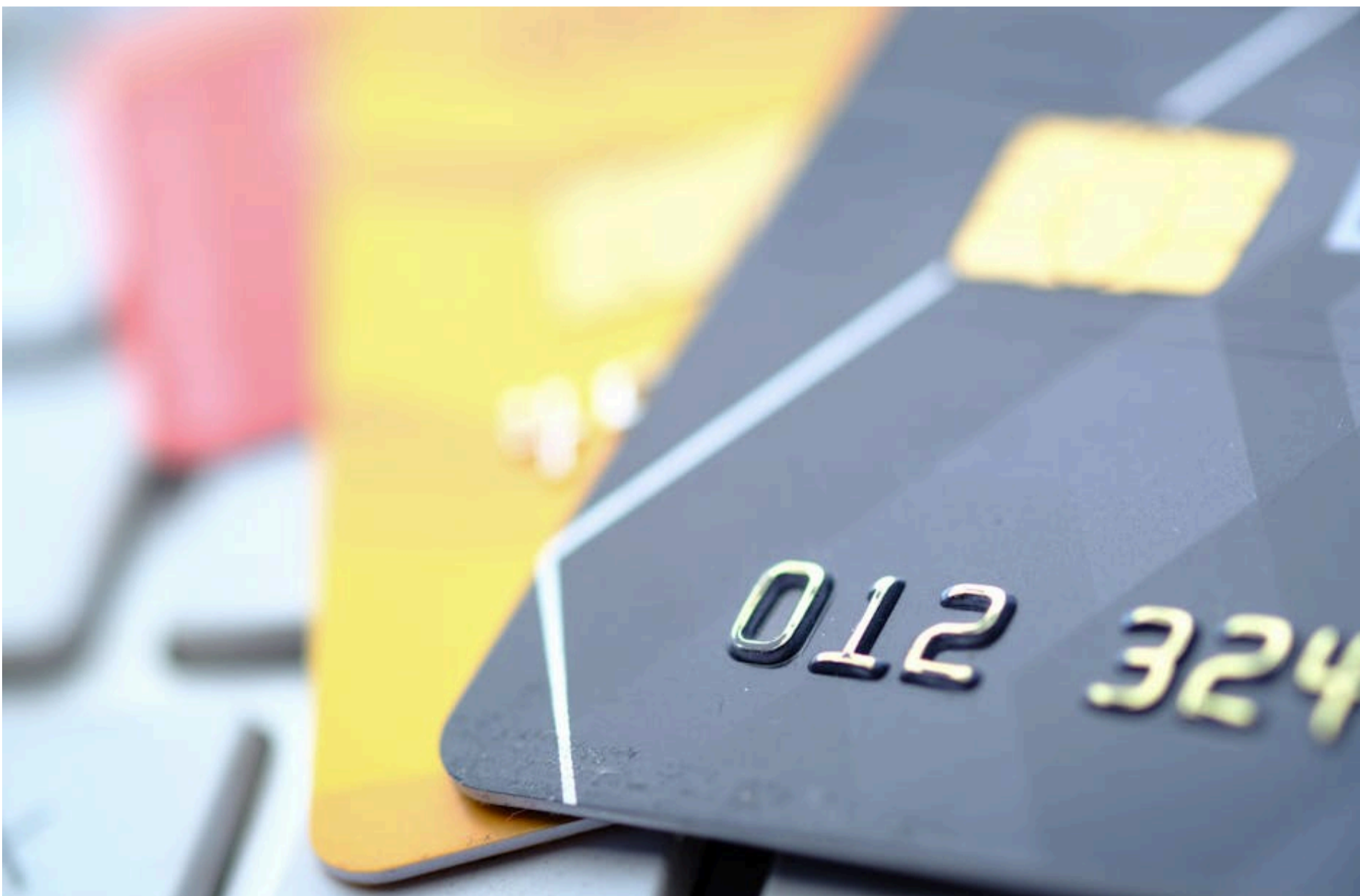
Банківські перекази

КОЛОМІЄЦЬ НАДІЯ — 07 Червня 2026, 18:26 2 Mins Read — ГРОШІ