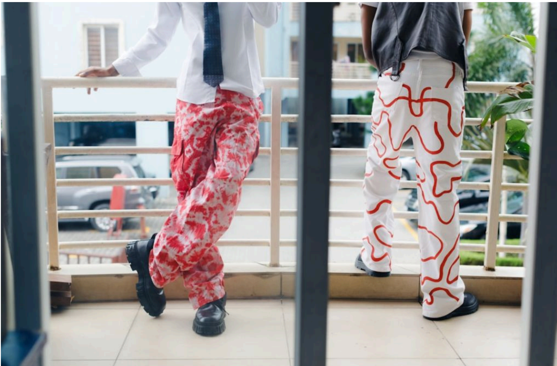
Піжамні штани

СТЕПАНЕНКО ГРИГОРІЙ — 07 Червня 2026, 18:36 2 Mins Read — МОДА І СТИЛЬ