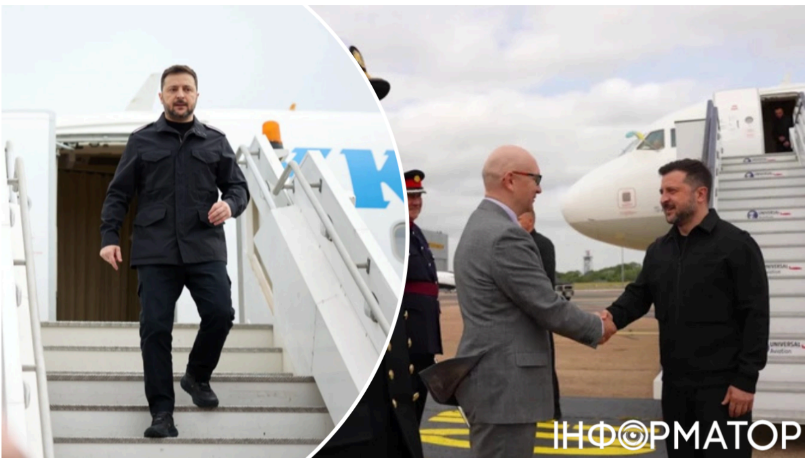
Зеленський у Лондоні на зустрічі з ЕЗ

Президент Володимир Зеленський прибув до Великої Британії та проведе переговори з прем'єром Кіром Стармером, президентом Франції Емманюелем Макроном і канцлером Німеччини Фрідріхом Мерцом. Зустріч у форматі "ЕЗ плюс Україна" відбудеться увечері неділі, 7 червня . Україна та союзники мають виробити спільну позицію щодо дипломатичних перспектив. На 8 червня запланована аудієнція у короля Чарльза III.