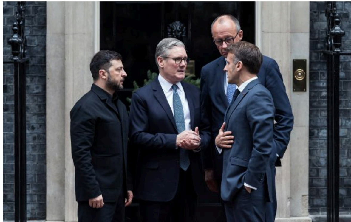
Фото: Володимир Зеленський з лідерами Британії, Франції та Німеччини (Getty Images)