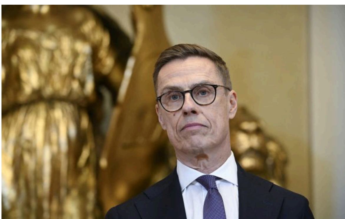
Фото: Президент Фінляндії Александр Стубб

Вимкни хаос міжнародних новин! Отримуй тільки важливе з РБК-Україна у Google