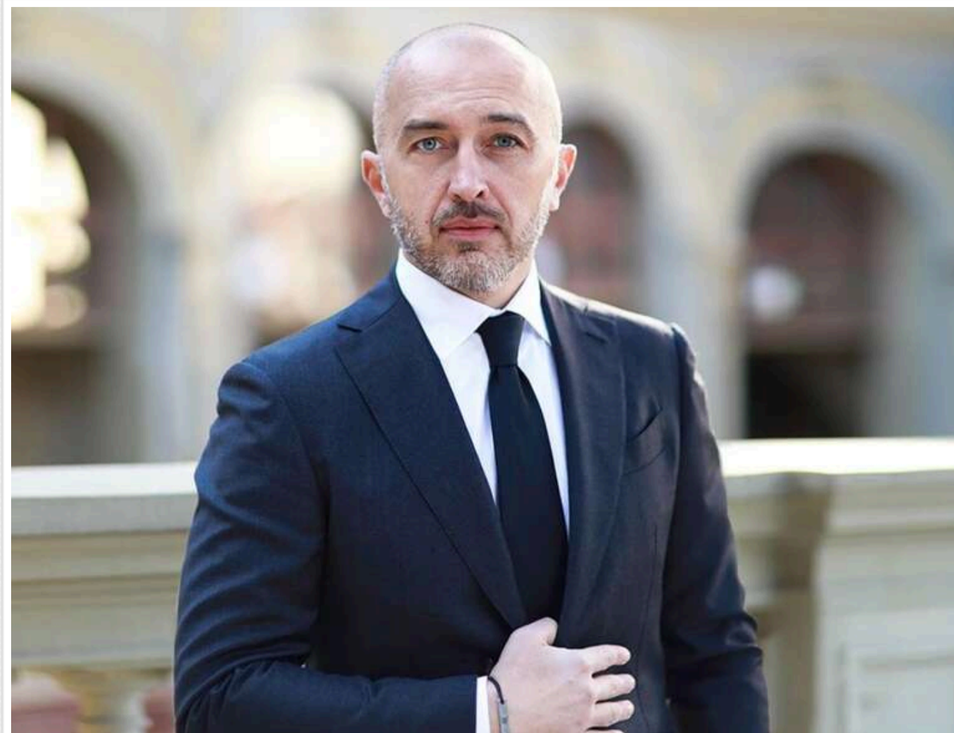
Нардеп Тищенко заявив про можливе звільнення голови НБУ Андрія Пишного

Народний депутат Микола Тищенко підтвердив інформацію про те, що голову Національного банку України Андрія Пишного можуть звільнити.