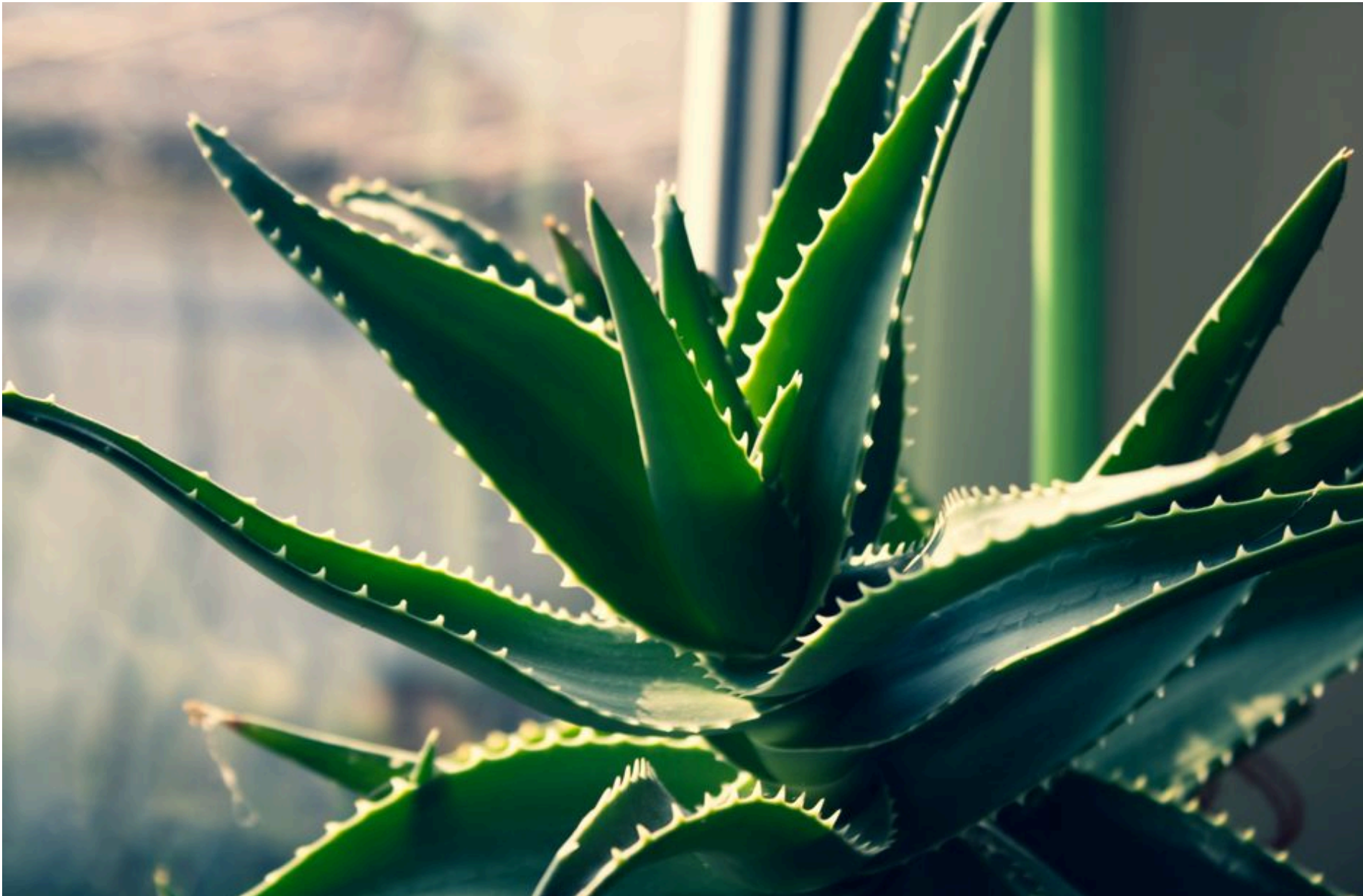
Алое вера

РОМАНЧУК МИКОЛА — 07 Червня 2026, 18:03 2 Mins Read — ДІМ ТА ІНТЕР'ЄР