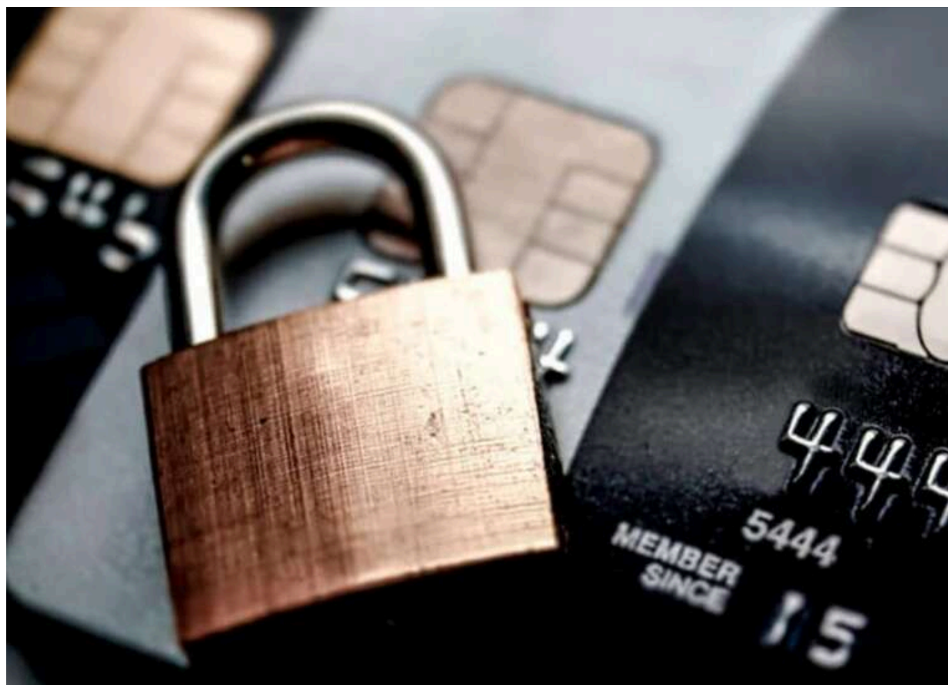
Телефонні аферисти змушують жертв «захищати рахунки» та крадуть кошти

Аферисти часто дзвонять українцям, видаючи себе за співробітників банку. Вони залякують можливим зломом рахунку й змушують розголошувати конфіденційні дані або самостійно переказувати гроші на свої рахунки. Щоб уникнути шахрайства, ніколи не повідомляйте телефоном коди, паролі чи реквізити картки. За будь-яких підозр одразу завершуйте розмову й самі телефонуйте до банку за офіційним номером.