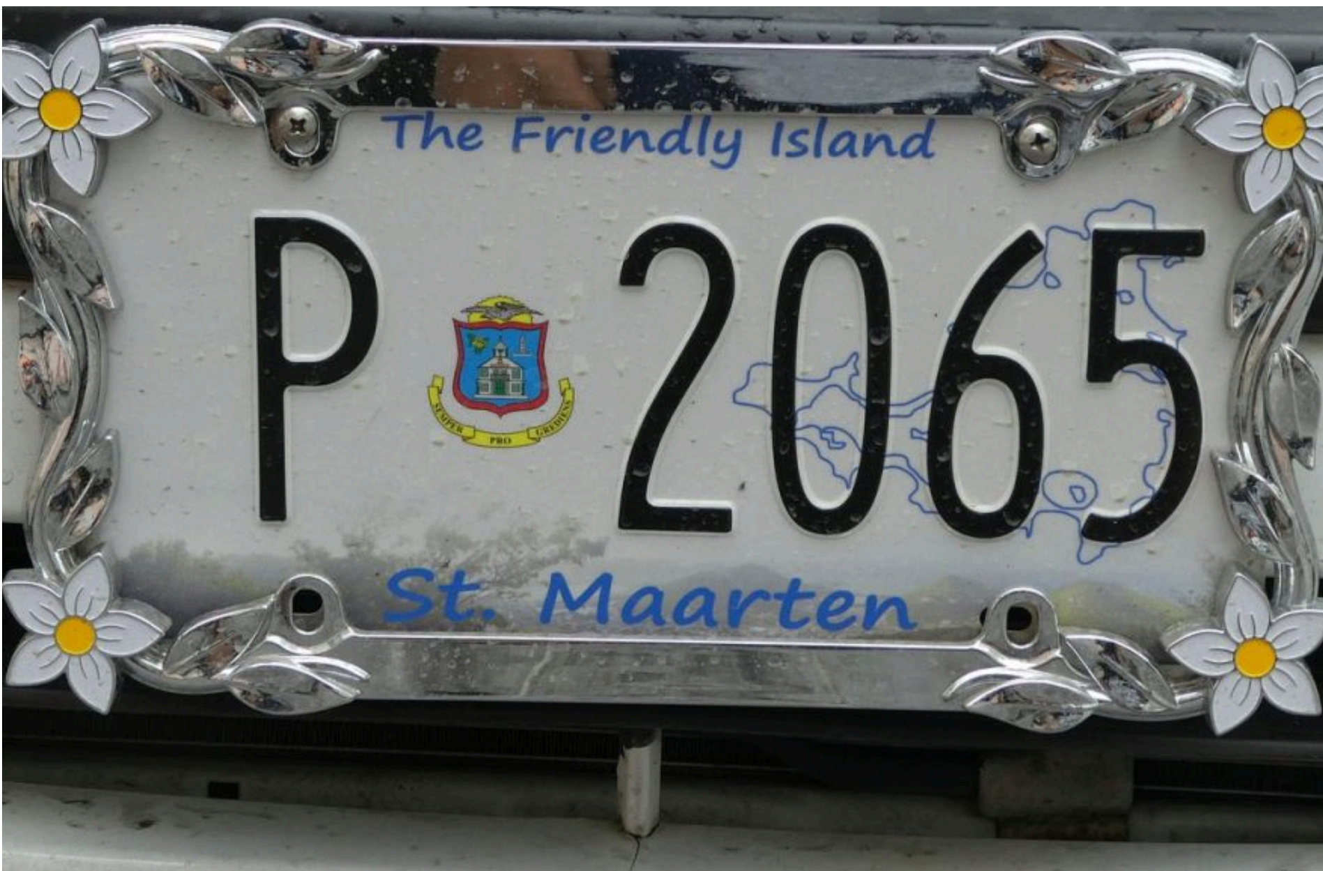
Номерні знаки

ДМИТРУК АНДРІЙ — 07 Червня 2026, 16:37 2 Mins Read — АВТО