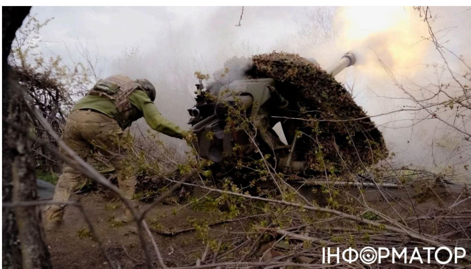
Зведення Генштабу ЗСУ

Російські загарбники 7 червня здійснили 71 атаку на позиції Сил оборони вздовж усієї лінії зіткнення. Найгарячішими ділянками залишаються Гуляйпільський, Покровський і Лиманський напрямки. Артилерійські обстріли знову накрили населені пункти одразу двох прикордонних областей.