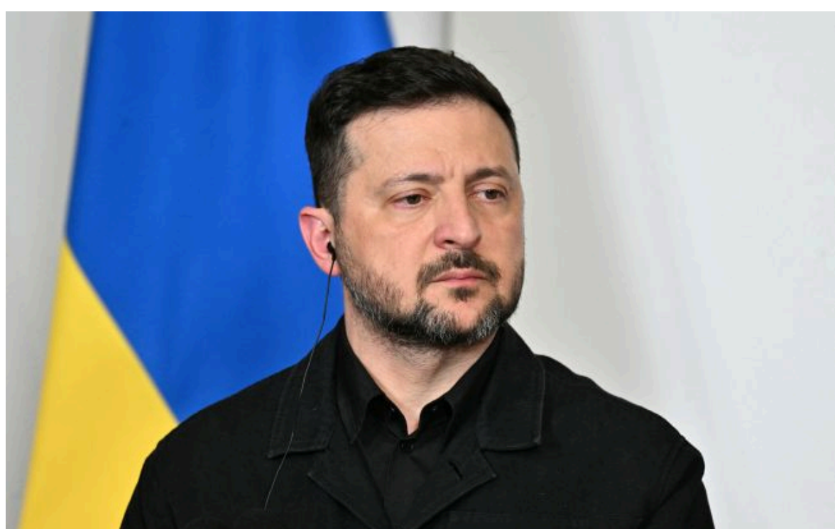
Фото: Президент України Володимир Зеленський (Getty Images)