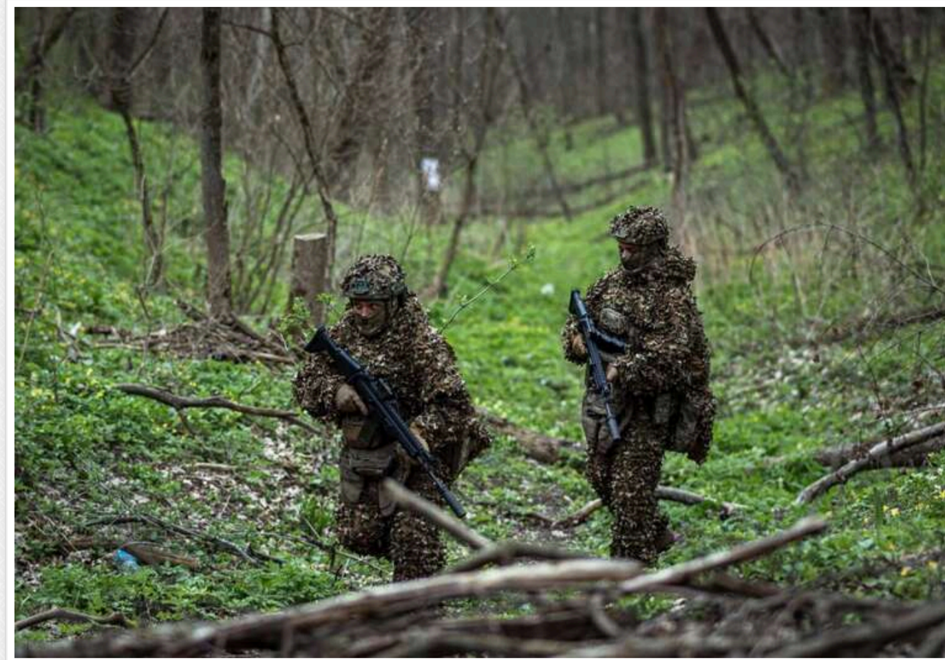
Ситуація на фронті: РФ 71 раз атакувала позиції ЗСУ за добу, найзапекліші бої — на Гуляйпільському та Покровському напрямках

Від початку доби російські війська 71 раз атакували позиції Сил оборони України. Найбільше боїв тривало на Гуляйпільському та Покровському напрямках.