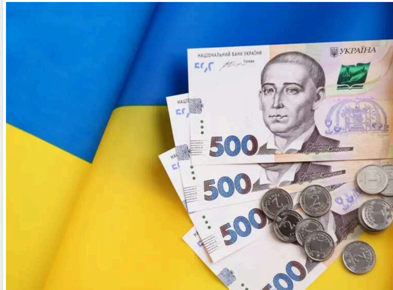
Мільйони готівки, авто і будинки: що посадовці у 2026 році отримують у подарунок

У 2026 році сотні посадовців уже встигли задекларувати подарунки від родичів. Найчастіше в деклараціях фігурує майно, яке дісталось від батьків, і це вважається нормою. Водночас іноді йдеться про мільйони гривень готівкою від бабусь, елітні автівки від батька-пенсіонера чи новозбудований триповерховий будинок.