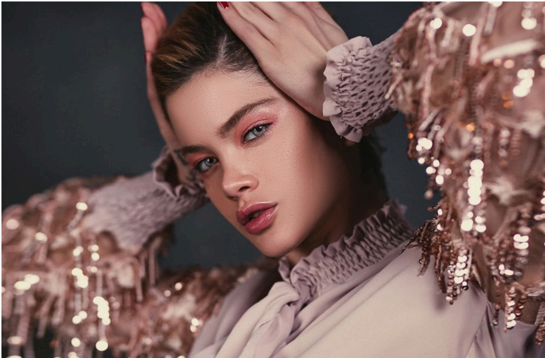
Б'юті тренди

СТЕПАНЕНКО ГРИГОРІЙ — 07 Червня 2026, 15:49 2 Mins Read — МОДА І СТИЛЬ